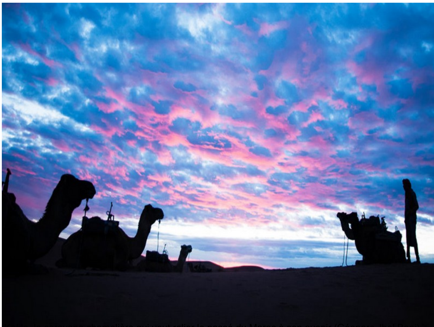
Kafila, la caravane chamelière qui veut relier le passé du Maroc à son avenir (Géoparc Jbel Bani)