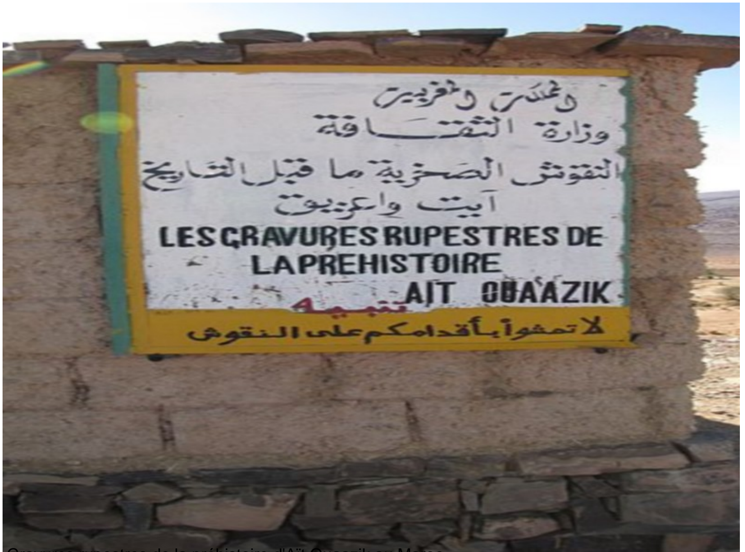
Gravures rupestres de la préhistoire d'Aït Ouazik au Maroc