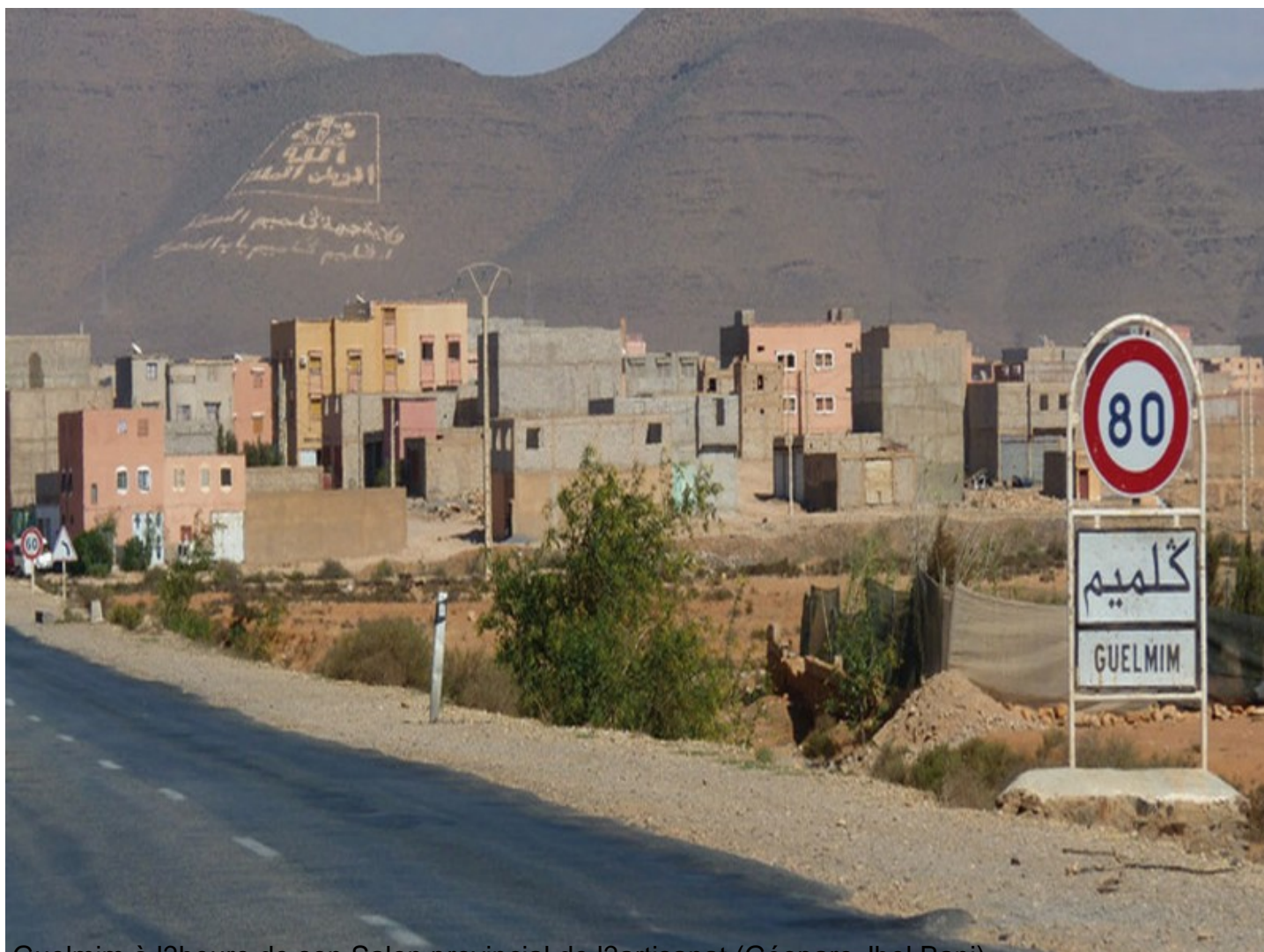
Guelmim à l'heure de son Salon provincial de l'artisanat (Géoparc Jbel Bani)