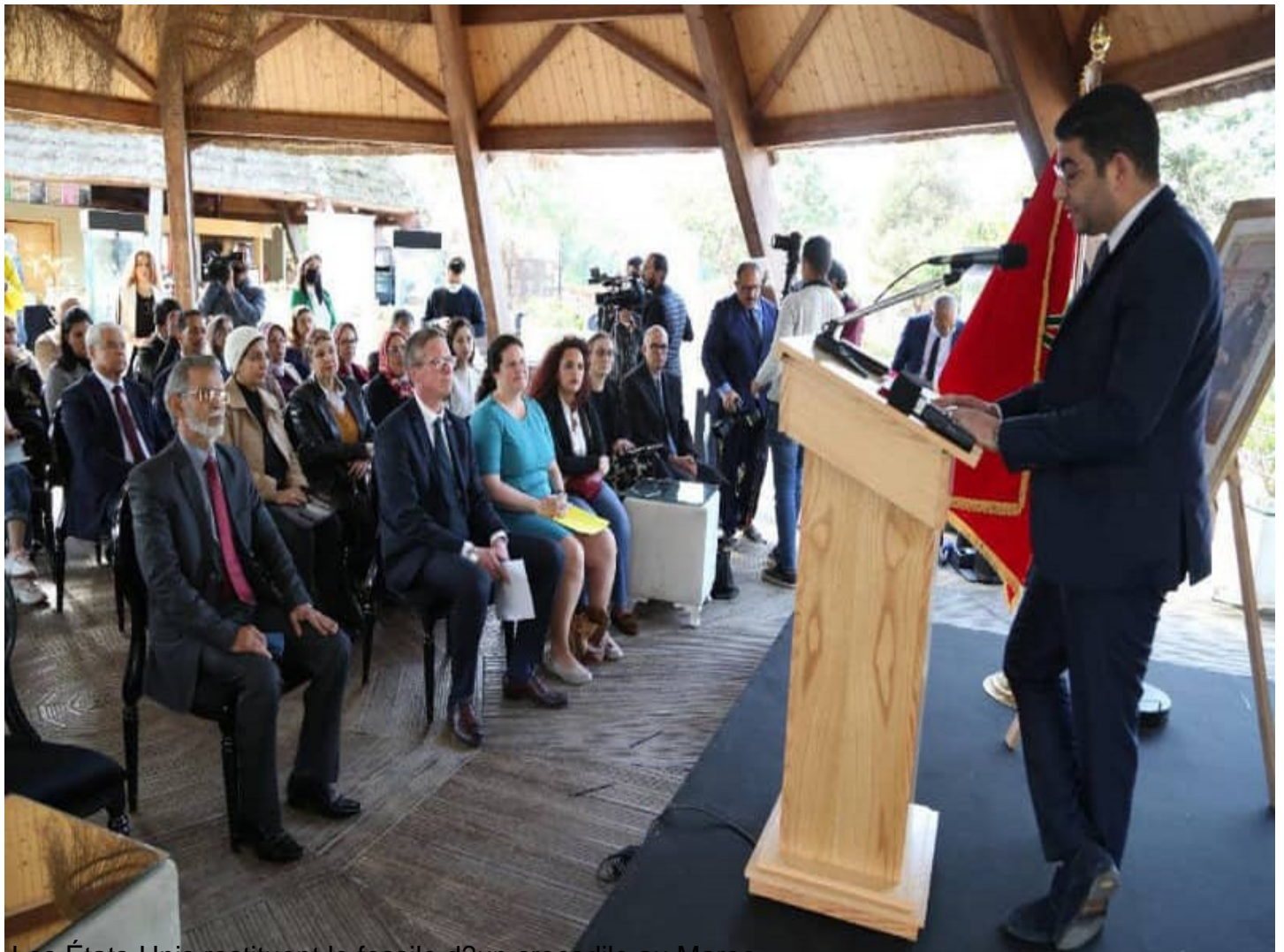
Les États-Unis restituent le fossile d'un crocodile au Maroc