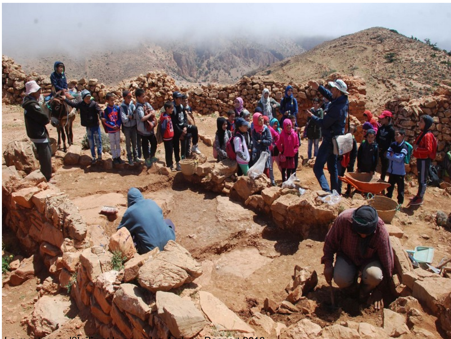
La montagne d'Igîlîz et le pays des Arghen. Rapport 2018