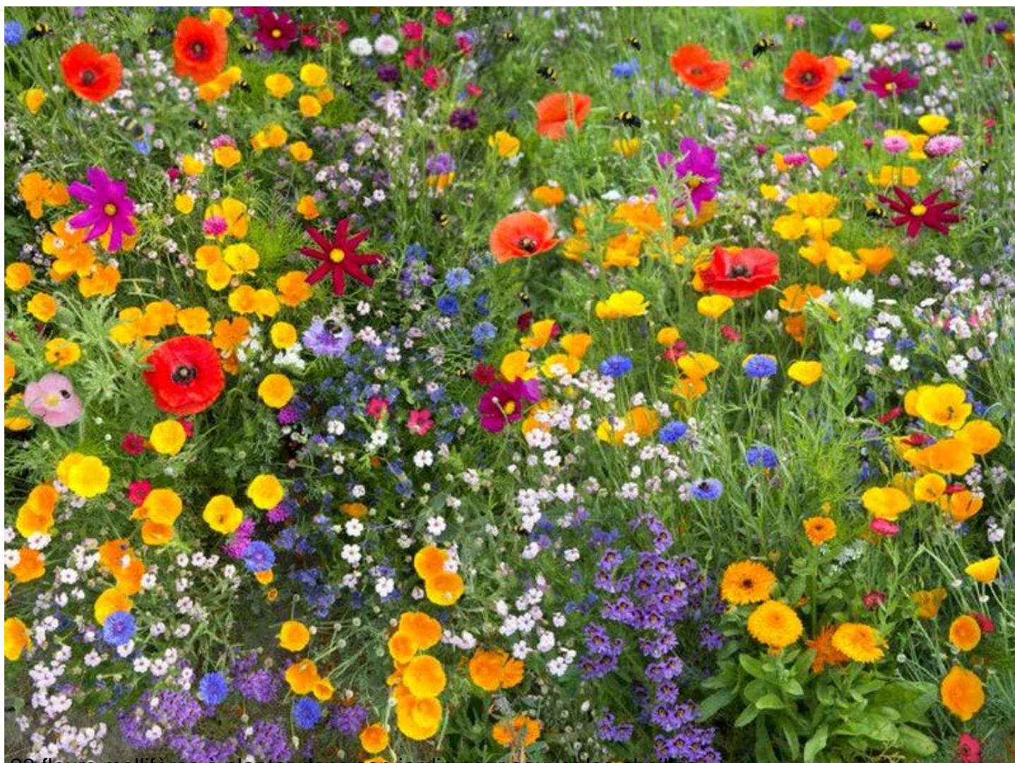
23 fleurs mellifères à planter dans son jardin pour sauver les abeilles