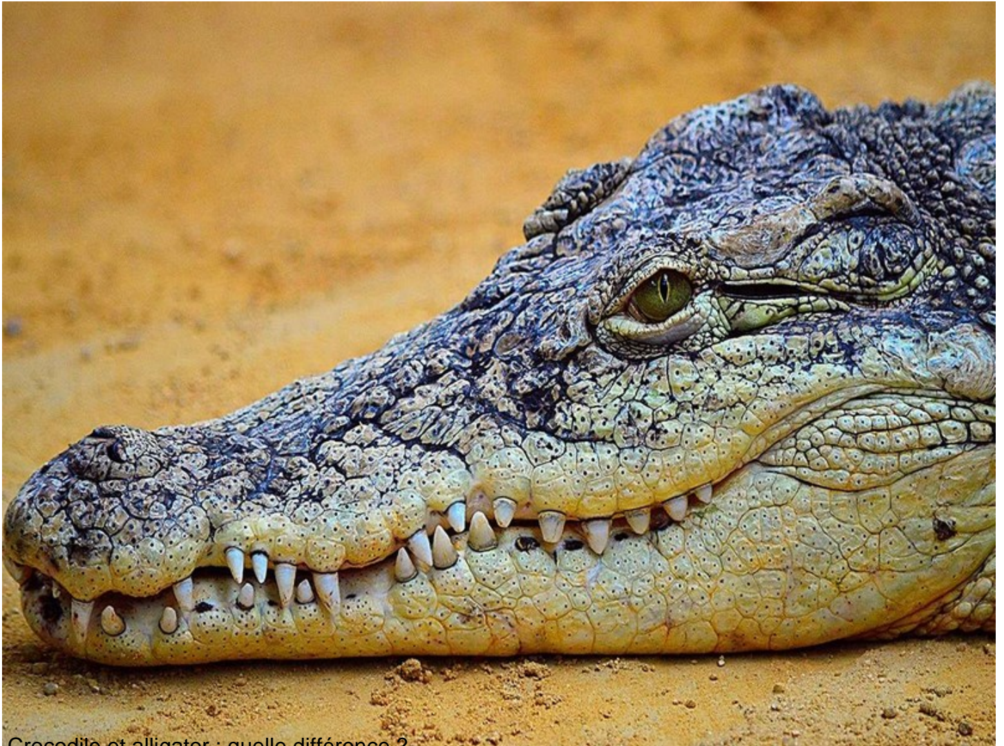
Crocodile et alligator : quelle différence ?